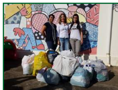
INSTITUIÇÃO DE AMPARO ARCA DE NOÉ