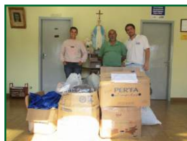
ANCIANATO ANTÔNIO FREDERICO OZANAM

A ACETC agradece mais uma vez à Rádio Tropical e Rádio Três pelo apoio e à toda população tricordiana que abraçou a campanha pelo bem estar do próximo.